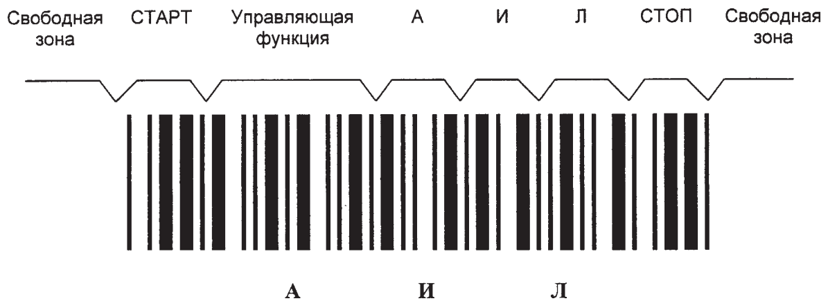
Рисунок Е.1 — Символ штрихового кода, в котором закодированы знаки АИЛ

Е.7 Для обеспечения дополнительной надежности при передаче данных с буквами русского алфавита используют контрольный знак символа набора Код 39РУ.