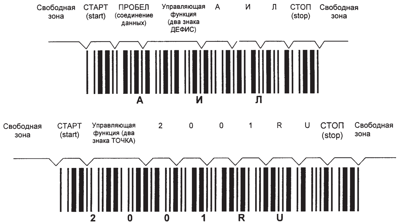
Рисунок Е.2 — Символы штрихового кода, в которых закодированы данные АИЛ2001RU