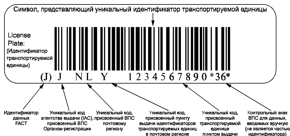
Рисунок В.2 — Пример представления уникальной идентификации транспортируемых единиц в символике штрихового кода Code 128 (Код 128)

В.2 Пример представления уникальной идентификации транспортируемых единиц в символике штрихового кода Code 128 (Код 128)** с идентификатором данных ФАКТ (ФАКТ)*** «J» и визуальным представлением приведен на рисунке В.2.