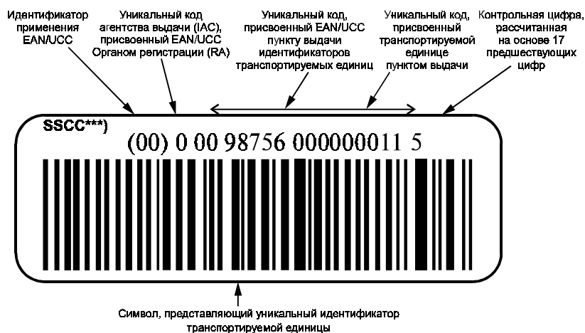
Рисунок В.1 — Пример представления уникальной идентификации транспортируемых единиц в символике штрихового кода EAN/UCC 128 с идентификатором применения EAN/UCC «00» и визуальным представлением знаков

В.1 Пример представления уникальной идентификации транспортируемых единиц в символике штрихового кода EAN/UCC 128* с идентификатором применения EAN/UCC** «00» и визуальным представлением знаков приведен на рисунке В.1.