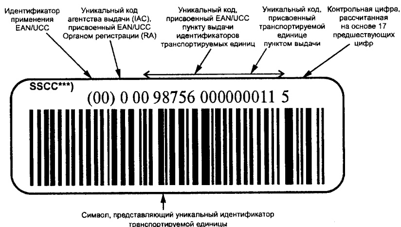
Рисунок В.1 — Пример представления уникальной идентификации транспортируемых единиц в символике штрихового кода EAN/UCC 128 с идентификатором применения EAN/UCC «00» и визуальным представлением

В.1 Пример представления уникальной идентификации транспортируемых единиц в символике штрихового кода EAN/UCC 128* с идентификатором применения EAN/UCC** «00» и визуальным представлением приведен на рисунке В.1.