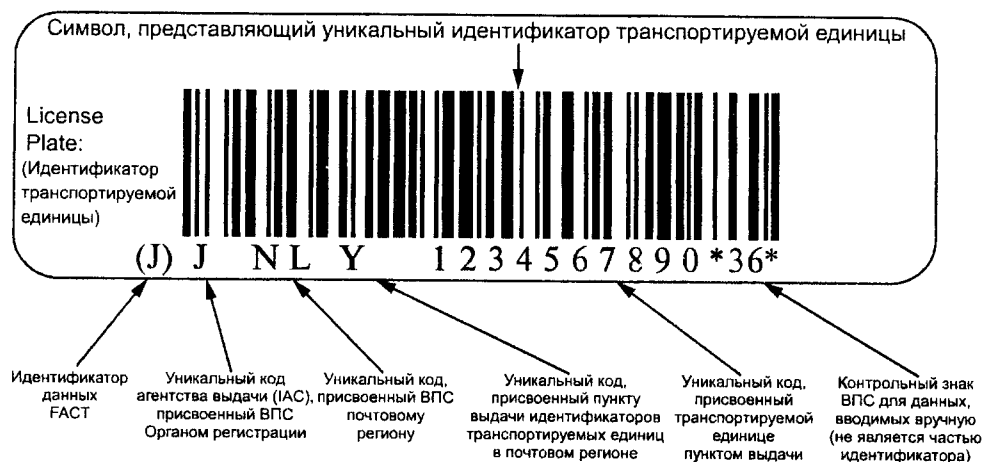
Рисунок В.2 — Пример представления уникальной идентификации транспортируемых единиц в символике штрихового кода Code 128 (Код 128)

В.2 Пример представления уникальной идентификации транспортируемых единиц в символике штрихового кода Code 128 (Код 128)** с идентификатором данных ФАКТ (ФАКТ)*** «Ј» и визуальным представлением приведен на рисунке В.2.