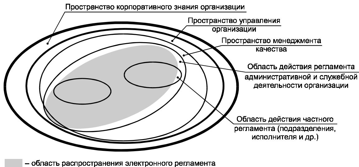
Рисунок А.1 — Соотношение (позиционирование) в организации системы (пространства) корпоративных знаний, пространства управления, системы управления (менеджмента) качества и регламента организации

На рисунке А.1 в условной форме показано соотношение (позиционирование) в организации системы (пространства) корпоративных знаний, пространства управления, системы управления (менеджмента) качества организации и ее регламентов.